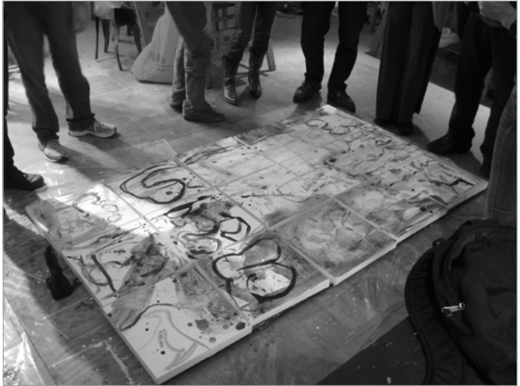
Trabajo en proceso / Working process