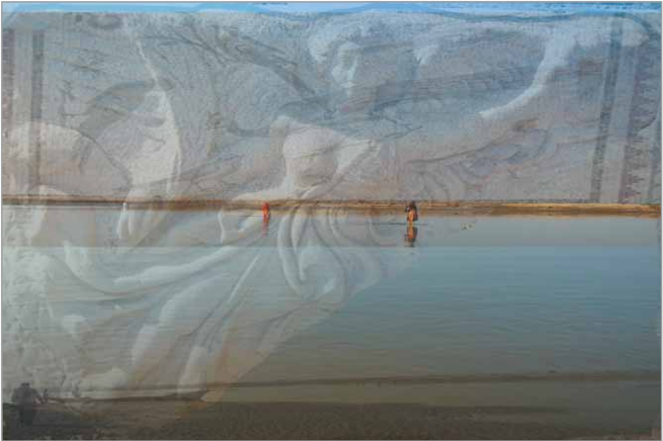
From Afrodasias to The Ravi - 2014 Layered photograph

Mansoor Hassan, Pakistán www.mansoorahassan.com