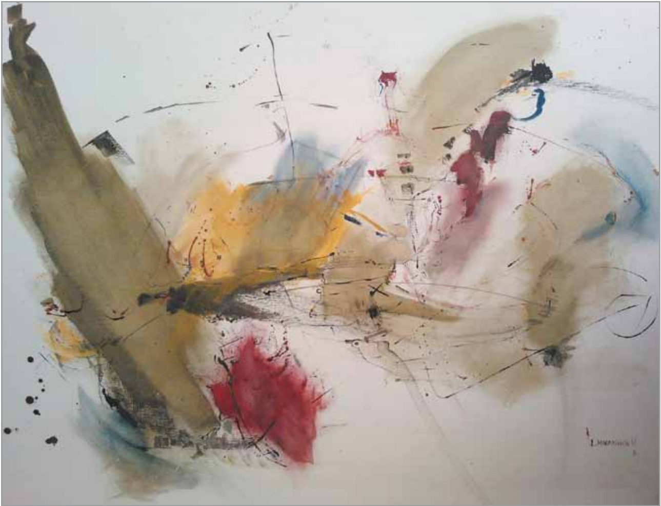
Agua Universal - 2013 Acrílico sobre tela