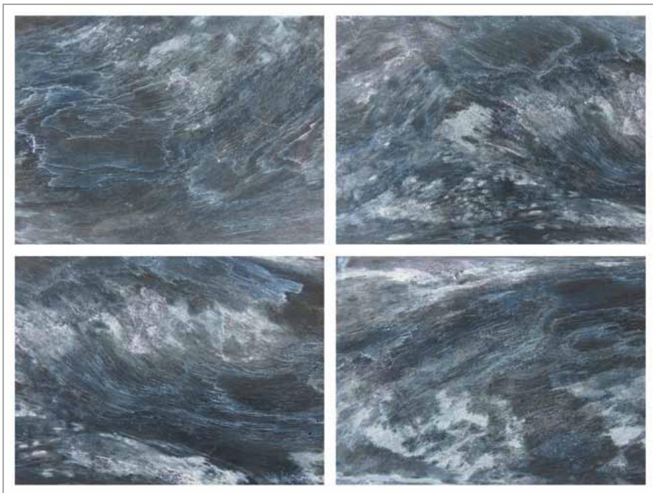
Ilbarritz, Madera del Mar - 2014 Photograph 2/5 print, pigment ink, Hahnemuhle paper

Mary-Ann Beall, Francia www.mary-ann-beall.net