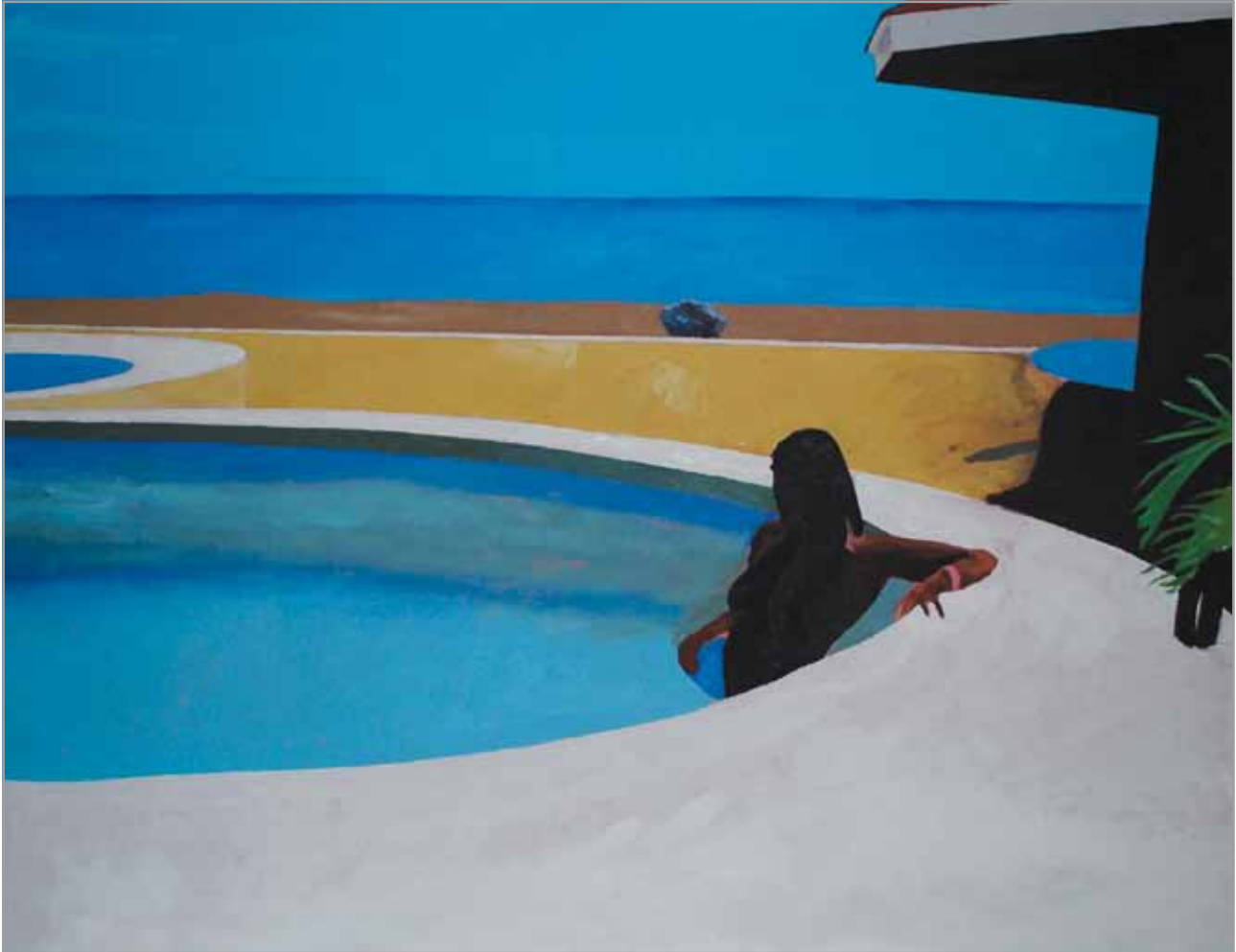
Port of Call - 2014 Acrylic on canvas