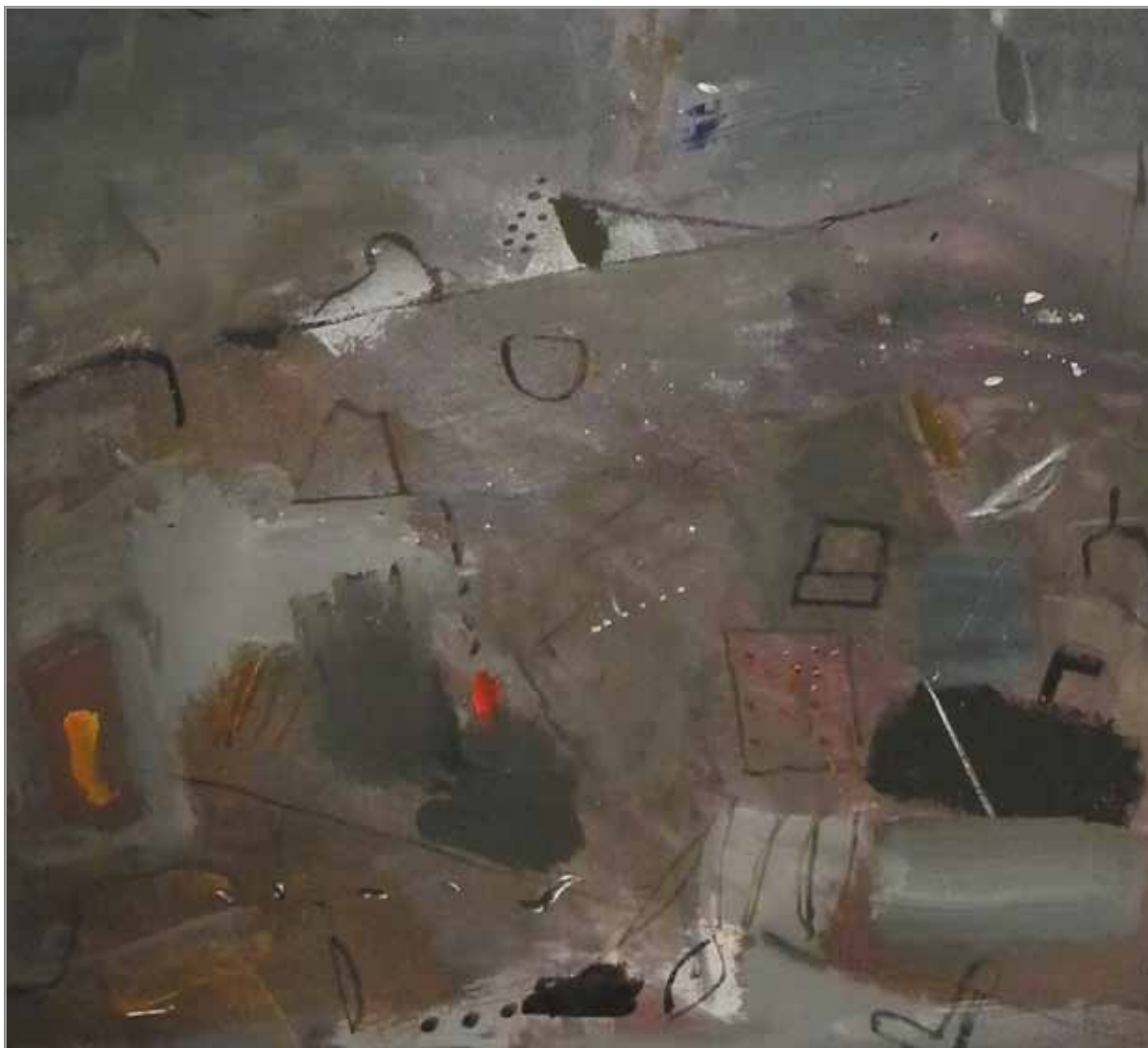
Génesis (detalle) - 2014 Técnica mixta - (100 x 70) cm

Ignacio Amorim, Uruguay www.ignacioamorim.com