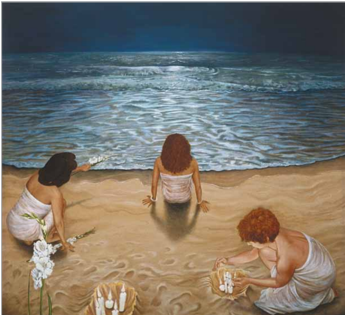
Yamaya: Goddess of the Sea - 2014 Digital print

Judy Jashinsky, EE.UU. www.jashinsky.com