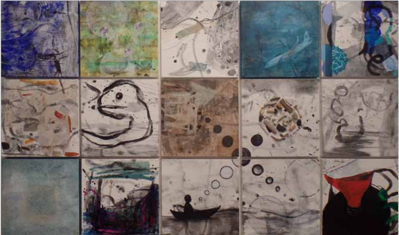
Los 15 artistas participaron en esta obra / The 15 artists participated in this collaborative work