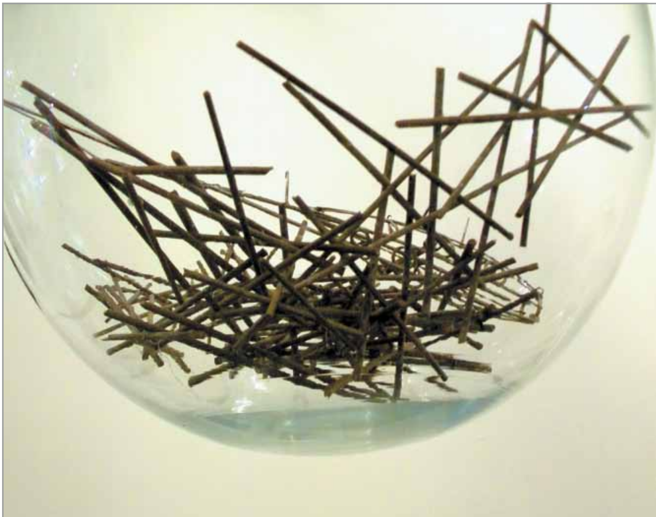
Como Peces en el Agua - 2014 Vidrio, metal, madera