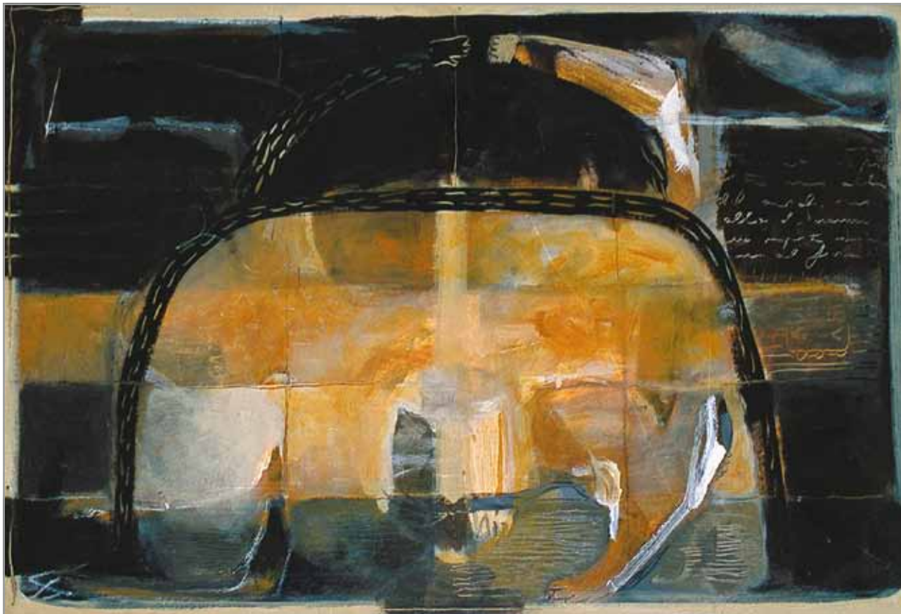
Sin título - 2004 Acrílico, lápiz sobre tela - (40 x 60) cm

Analía Sandleris, Uruguay analiasandleris@.com