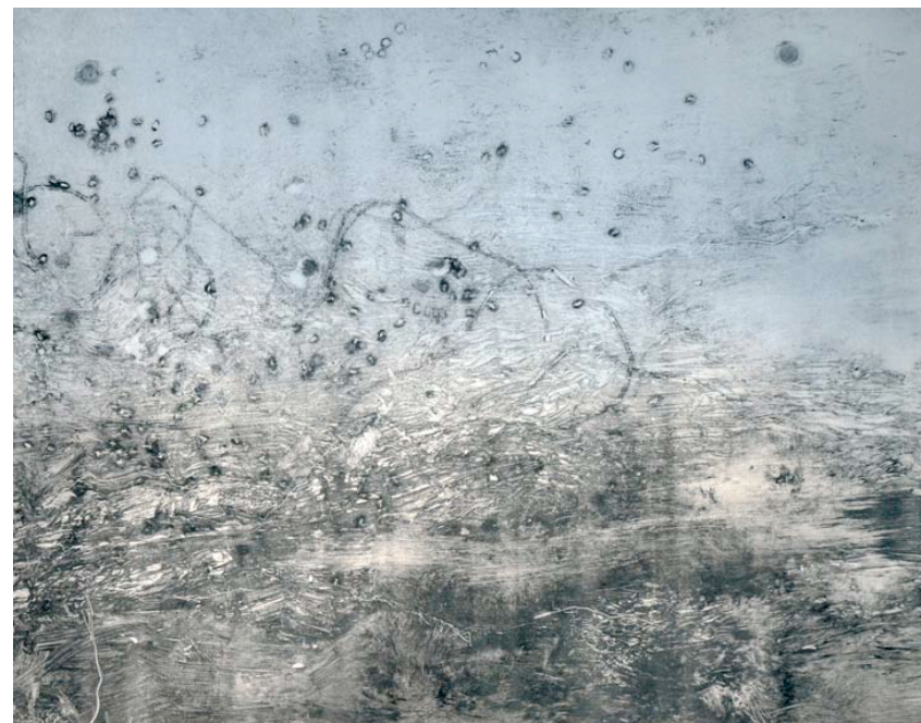
entre-deux n°2 あいだn°2 モノタイプ42 x 48cm 2010年