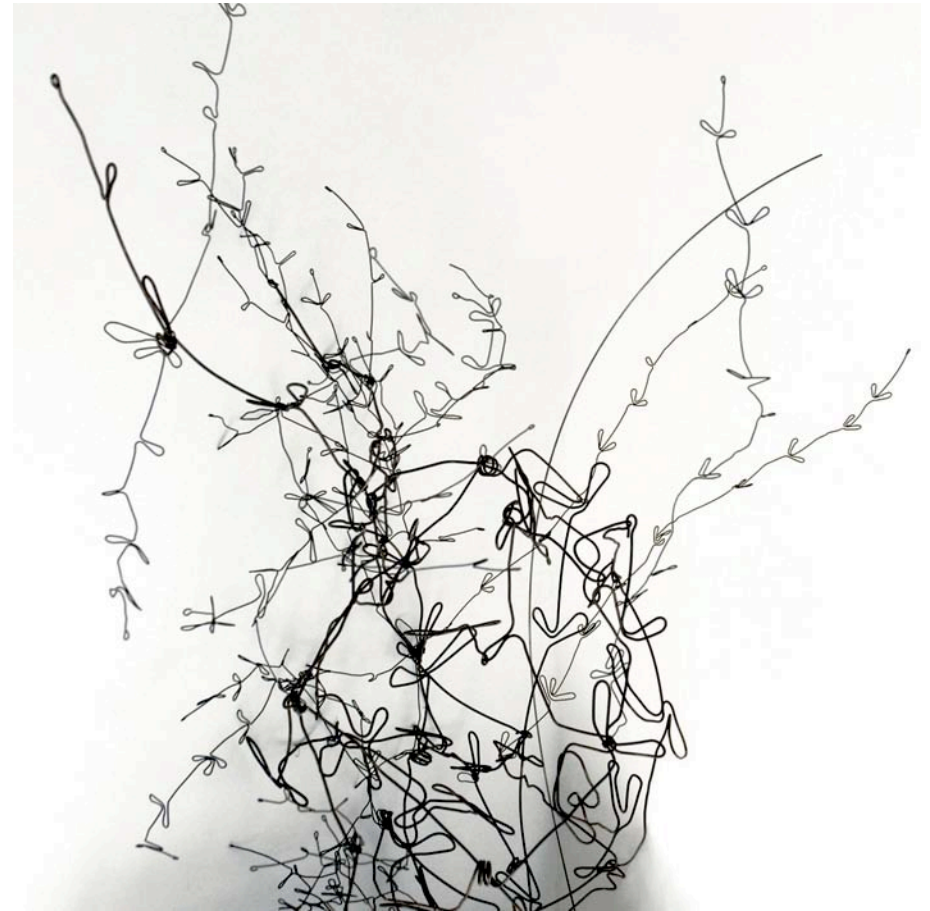
broussaille 茂み スチール2010年

38 RUE FEUTRIER 75018 PARIS パリ18区 フトリエ通り38番地